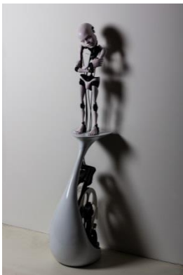
"DESIRING MACHINE" (2017) 151x40x30cm CHF 53'000*

Последняя скульптура экспозиции, Playground II , представляет собой интерактивное устройство, оснащенное механизмом, который позволит зрителю пережить уникальный музыкальный опыт.