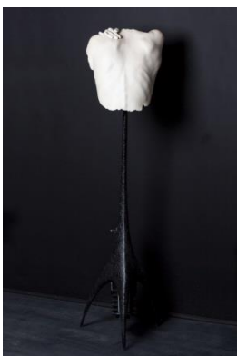
"HAND ON THE SHOULDER" (2017) 146x35x36cm CHF 35'500*