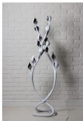
"PLAYGROUND II" (2017) 157x50x40cm CHF 41'500*