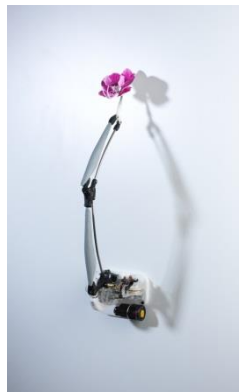
"PURPLE FLOWER OF THE MACHINE" (2015) 80x20x30cm CHF 23'500*