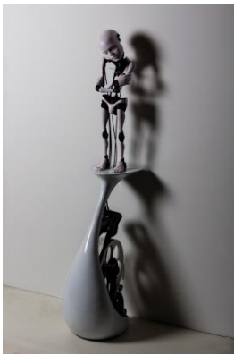
“DESIRING MACHINE” (2017) 151×40×30cm CHF 53'000*

最后， Playground II 则是一件互动雕塑，内建的机械结装置邀请观者创造专属的音乐体验。