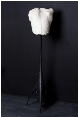
“HAND ON THE SHOULDER” (2017) 146×35×36cm CHF 35'500*