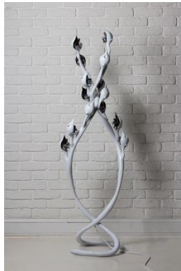
“PLAYGROUND II” (2017) 157×50×40cm CHF 41'500*