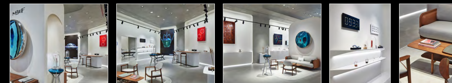
MB&F M.A.D.GALLERY DUBAI 6