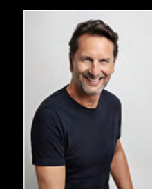
MAXIMILIAN BÜSSER PORTRAIT 1