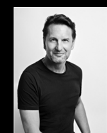
MAXIMILIAN BÜSSER PORTRAIT 2