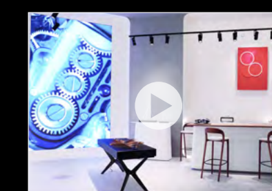
NEW ARCHITECTURAL IDENTITY