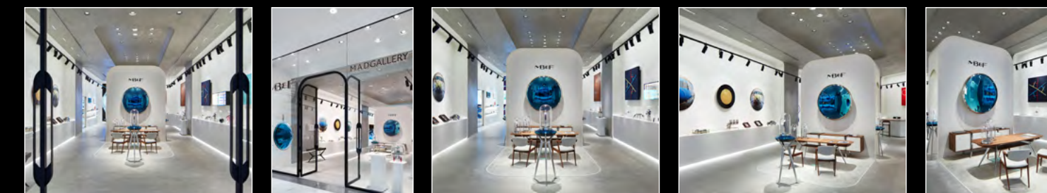
MB&F M.A.D.GALLERY DUBAI 1