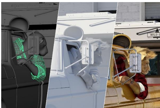
3D-預覽 /測試光線/ 影像成品

整個過程並非流暢地線性進行，其中幾個步驟需經過數次測試階段，以達到 Müller 心目中追求的品質，耗費大量時間以加入無數細節，「Rides of the Wild」歷經近三年的時間才得以完工。