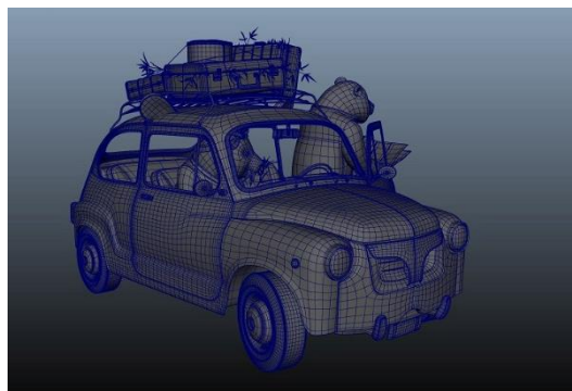
完成 3D 模型