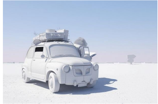
预览打光的渲染效果