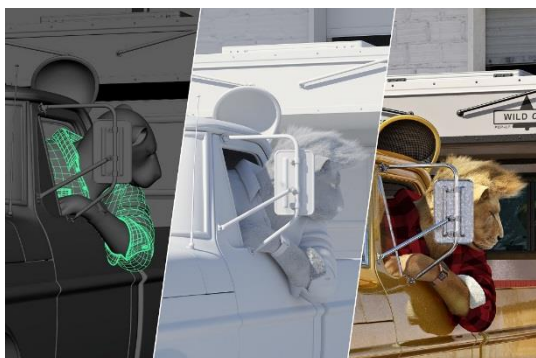
3D 预览/测试打光/最终图像

创作过程完全不是循序渐进，因为每个步骤都必须一再进行测试，才能制作出 Müller 构思的成品图像。整合多如牛毛的细节还须要花费大量时间；“Rides of the Wild”（狂野飙风）系列从头到尾历时将近三年才完成。